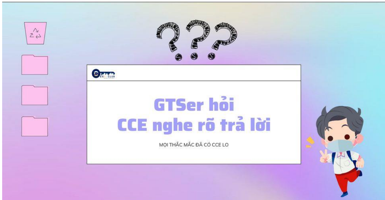
Hình 3. Workshop: GTSer hỏi_CCE nghe rõ trả lời