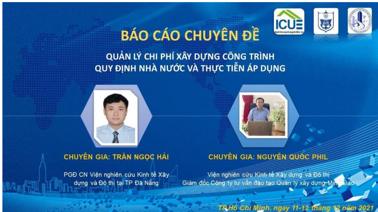
Hình 4. Hỗ trợ truyền thông: Chuyên đề Quản lý chi phí xây dựng công trình quy định Nhà nước và thực tiễn áp dụng