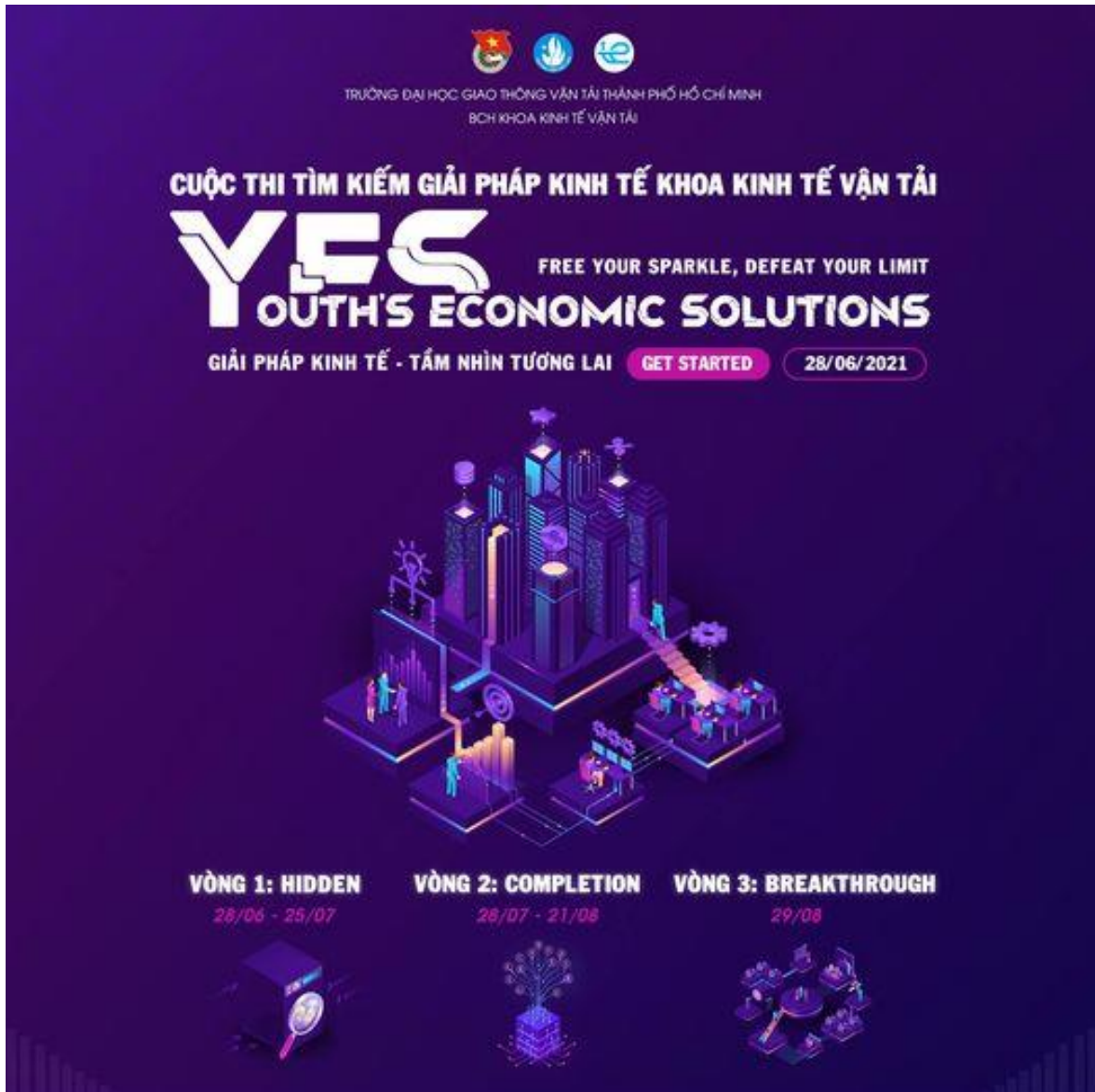
Hình 2. Hỗ trợ truyền thông: Cuộc thi Tìm kiếm giải pháp kinh tế khoa Kinh tế vận tải 2021 (YES)